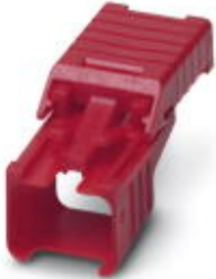
Lockable security element

Please be informed that the data shown in this PDF Document is generated from our Online Catalog. Please find the complete data in the user's documentation. Our General Terms of Use for Downloads are valid ( http://download.phoenixcontact.com )