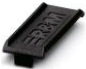
Color marking for FL PATCH GUARD, black

Color-coding - FL PATCH GUARD CCODE BK - 2891136