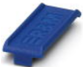
Color marking for FL PATCH GUARD, blue

Color-coding - FL PATCH GUARD CCODE BU - 2891233