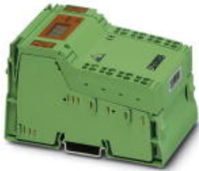
AS-i Gateway for Inline, IP20 protection, color: Green

Please be informed that the data shown in this PDF Document is generated from our Online Catalog. Please find the complete data in the user's documentation. Our General Terms of Use for Downloads are valid ( http://phoenixcontact.com/download )