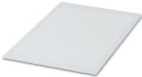
The figure shows a version of the article

Marker sheet, Din A4, yellow, Unlabeled, Can be labeled with: Plotter, Office printing systems, Mounting type: Adhesive, Lettering field: 296 x 210 mm