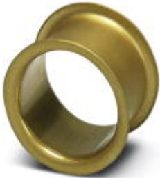
Adapter sleeve, Nominal current: 10 A, Color: red

Please be informed that the data shown in this PDF Document is generated from our Online Catalog. Please find the complete data in the user's documentation. Our General Terms of Use for Downloads are valid ( http://phoenixcontact.com/download )