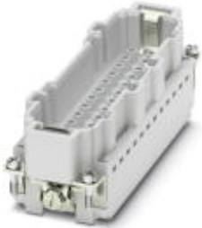
HEAVYCON pin insert, for 830 V (III/3), with 10 N/O contacts and 2 switch contacts, crimp connection

Please be informed that the data shown in this PDF Document is generated from our Online Catalog. Please find the complete data in the user's documentation. Our General Terms of Use for Downloads are valid ( http://phoenixcontact.com/download )