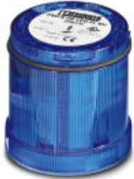
LED flashing beacon element, 24 V DC, double lightning, blue

Please be informed that the data shown in this PDF Document is generated from our Online Catalog. Please find the complete data in the user's documentation. Our General Terms of Use for Downloads are valid ( http://phoenixcontact.com/download )