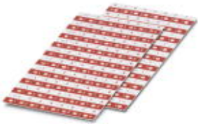
The figure shows a version of the article

Pair of marking masks, in positive/negative, white/red print for marking the individual pins, with horizontal printing, front print: 0-7, back print: 7-0