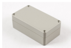
Beige ABS plastic