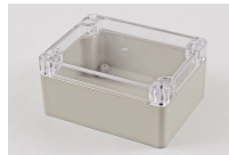
Beige ABS plastic with clear polycarbonate lid