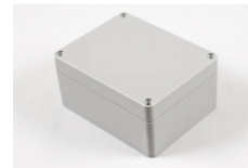
Light gray polycarbonate