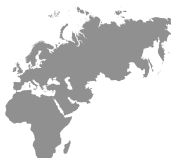
Europe Middle East Africa