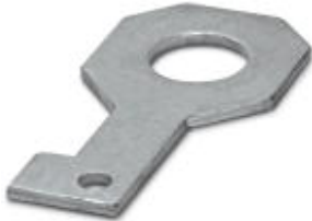
Plate for fixing the FLT-ISG-100-EX isolating spark gap to a flange, drill hole diameter of 33 mm.

Please be informed that the data shown in this PDF Document is generated from our Online Catalog. Please find the complete data in the user's documentation. Our General Terms of Use for Downloads are valid ( http://phoenixcontact.com/download )