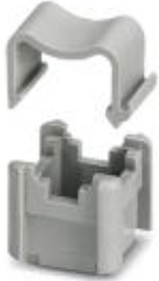
Support bracket for busbars

Please be informed that the data shown in this PDF Document is generated from our Online Catalog. Please find the complete data in the user's documentation. Our General Terms of Use for Downloads are valid ( http://phoenixcontact.com/download )