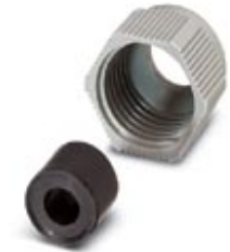
D-SUB cap nut with line seal, for conductor diameter of 5 mm ... 13 mm, for sleeve housing VS-25-...

Please be informed that the data shown in this PDF Document is generated from our Online Catalog. Please find the complete data in the user's documentation. Our General Terms of Use for Downloads are valid ( http://download.phoenixcontact.com )