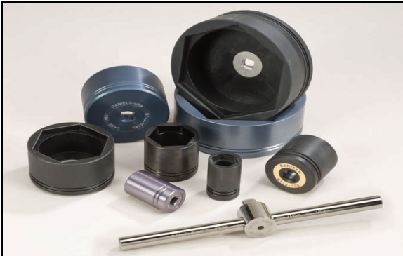
DMC1358 COMPOSITE JAM NUT TOOL KIT

The correct application of torque is essential to most connector applications where Jam Nut receptacle connectors are used. The sealing components (usually an "O" ring) must be compressed, but not to the point of damage. Another important consideration when tightening Jam Nuts is the thread strength, especially in the various types of aluminum and composite connectors.