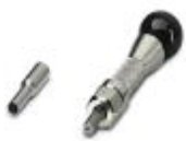
Contact removal tool for coaxial contacts