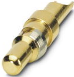
Power contacts, for D-SUB combination inserts, pin, solder cup, straight, rated current 20 A, gold-plated

Please be informed that the data shown in this PDF Document is generated from our Online Catalog. Please find the complete data in the user's documentation. Our General Terms of Use for Downloads are valid ( http://download.phoenixcontact.com )