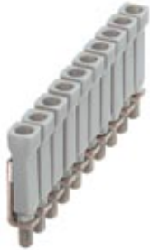
Jumper, Number of positions: 10, Color: gray

Please be informed that the data shown in this PDF Document is generated from our Online Catalog. Please find the complete data in the user's documentation. Our General Terms of Use for Downloads are valid ( http://download.phoenixcontact.com )