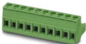
The figure shows a 10-position version of the product

PCB connector, nominal current: 12 A, number of positions: 6, pitch: 5.08 mm, connection method: Screw connection with tension sleeve, color: green, contact surface: Tin