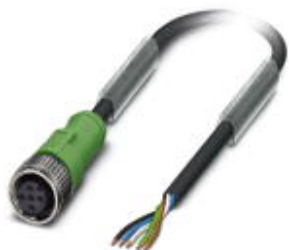
Sensor/actuator cable, 5-position, PUR halogen-free, black-gray RAL 7021, free cable end, on Socket straight M12, B-coded, cable length: 10 m

Please be informed that the data shown in this PDF Document is generated from our Online Catalog. Please find the complete data in the user's documentation. Our General Terms of Use for Downloads are valid ( http://phoenixcontact.com/download )