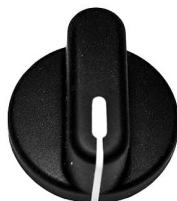
5940E, 5920E, 5930E