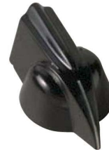
5600E, 5601E, 5602E