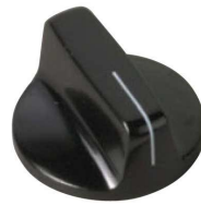
5500E, 5520E, 5521E