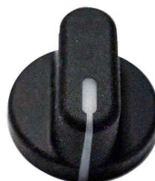
5941E, 5921E, 5931E