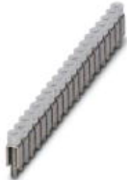
Fixed bridge, Number of positions: 20, Color: silver

Please be informed that the data shown in this PDF Document is generated from our Online Catalog. Please find the complete data in the user's documentation. Our General Terms of Use for Downloads are valid ( http://download.phoenixcontact.com )