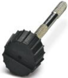
Fillister head screw with plastic knurl, M3 x 40

Please be informed that the data shown in this PDF Document is generated from our Online Catalog. Please find the complete data in the user's documentation. Our General Terms of Use for Downloads are valid ( http://phoenixcontact.com/download )