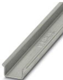
DIN rail, material: Steel, unperforated, 2.3 mm thick, height 15 mm, width 35 mm, length: 2 m

Please be informed that the data shown in this PDF Document is generated from our Online Catalog. Please find the complete data in the user's documentation. Our General Terms of Use for Downloads are valid ( http://download.phoenixcontact.com )