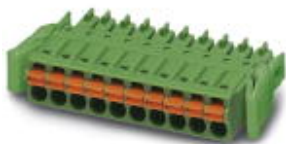
The figure shows a 10-position version of the product

PCB connector, nominal current: 8 A, number of positions: 7, pitch: 3.5 mm, connection method: Push-in spring connection, color: cream, contact surface: Tin