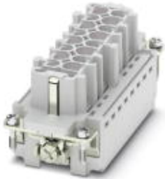
HEAVYCON socket insert, for 830 V (III/3), with 6 N/O contacts and 2 switch contacts, crimp connection

Please be informed that the data shown in this PDF Document is generated from our Online Catalog. Please find the complete data in the user's documentation. Our General Terms of Use for Downloads are valid ( http://phoenixcontact.com/download )