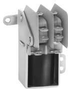
S86R Mounting Style 1