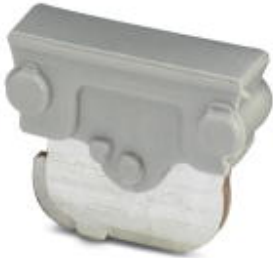
Feed-through connector, Length: 10.5 mm, Width: 4 mm, Color: gray

Please be informed that the data shown in this PDF Document is generated from our Online Catalog. Please find the complete data in the user's documentation. Our General Terms of Use for Downloads are valid ( http://phoenixcontact.com/download )