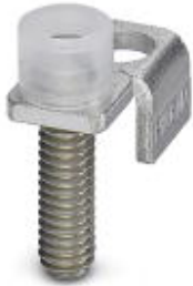
Chain bridge, Number of positions: 1, Color: silver

Please be informed that the data shown in this PDF Document is generated from our Online Catalog. Please find the complete data in the user's documentation. Our General Terms of Use for Downloads are valid ( http://phoenixcontact.com/download )