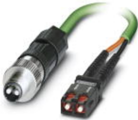
PCF-GI cable, assembled with M12 connector to SC-RJ

Please be informed that the data shown in this PDF Document is generated from our Online Catalog. Please find the complete data in the user's documentation. Our General Terms of Use for Downloads are valid ( http://phoenixcontact.com/download )