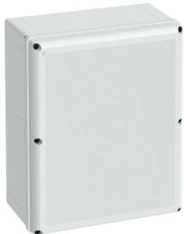
Cat No. 700-745 GEOS-L 4050-22-o with grey cover