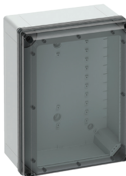
Cat No. 701-745 GEOS-L 4050-22-to with transparent cover