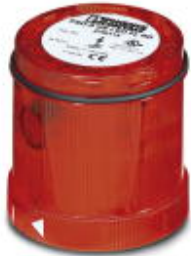
LED flashing beacon element, 24 V DC, double flash, red

Please be informed that the data shown in this PDF Document is generated from our Online Catalog. Please find the complete data in the user's documentation. Our General Terms of Use for Downloads are valid ( http://phoenixcontact.com/download )