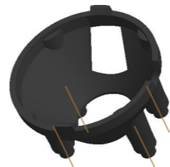
GENERAL 3D VIEW SCALE 1:1

DIM. B (SEE TABLE) ZERO DRAFT OVER THIS LENGTH