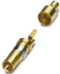
Coaxial contact, for D-SUB combination inserts, solder cup, socket, straight, for cable RG -178, gold-plated

Please be informed that the data shown in this PDF Document is generated from our Online Catalog. Please find the complete data in the user's documentation. Our General Terms of Use for Downloads are valid ( http://phoenixcontact.com/download )