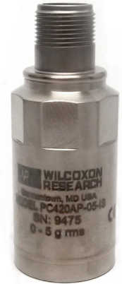
Table 1: PC420Ax-yy-IS model selection guide