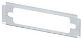
D-SUB EMC shroud, shell size 3, for panel mounting frame VS-25-...

Please be informed that the data shown in this PDF Document is generated from our Online Catalog. Please find the complete data in the user's documentation. Our General Terms of Use for Downloads are valid ( http://download.phoenixcontact.com )