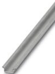
DIN rail, material: Steel, unperforated, height 5.5 mm, width 15 mm, length: 2 m

Please be informed that the data shown in this PDF Document is generated from our Online Catalog. Please find the complete data in the user's documentation. Our General Terms of Use for Downloads are valid ( http://download.phoenixcontact.com )