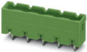
The figure shows a 5-pos. version of the product

PCB headers, nominal current: 16 A, number of positions: 6, pitch: 7.62 mm, color: gray, contact surface: Tin, mounting: Wave soldering