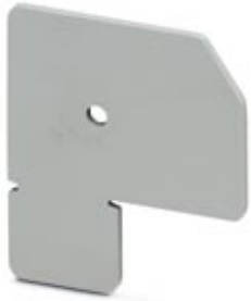
Separating plate, Width: 2 mm, Number of positions: 0, Color: gray

Please be informed that the data shown in this PDF Document is generated from our Online Catalog. Please find the complete data in the user's documentation. Our General Terms of Use for Downloads are valid ( http://download.phoenixcontact.com )