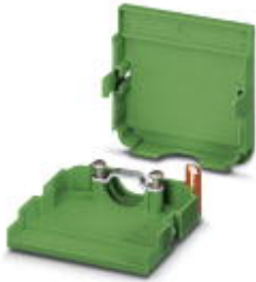
Cable housing, Pitch: 3.81 mm, Number of positions: 9, Dimension a: 36.68 mm, Color: green

Please be informed that the data shown in this PDF Document is generated from our Online Catalog. Please find the complete data in the user's documentation. Our General Terms of Use for Downloads are valid ( http://download.phoenixcontact.com )