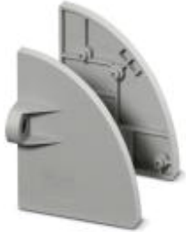
Flange cover, Color: gray

Please be informed that the data shown in this PDF Document is generated from our Online Catalog. Please find the complete data in the user's documentation. Our General Terms of Use for Downloads are valid ( http://download.phoenixcontact.com )