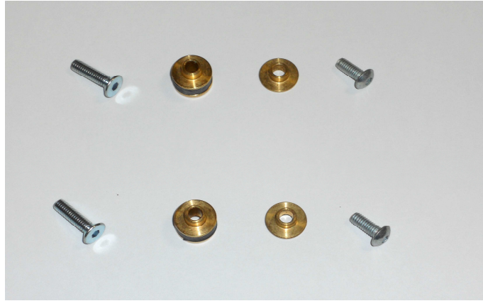
REPLACEMENT EJECTOR BUSH KIT