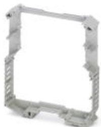
Complete housing, length: 99 mm, Central part, color: light gray, width: 17.5 mm

Please be informed that the data shown in this PDF Document is generated from our Online Catalog. Please find the complete data in the user's documentation. Our General Terms of Use for Downloads are valid ( http://phoenixcontact.com/download )