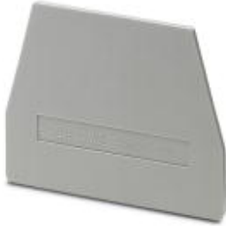
End cover, Length: 61 mm, Width: 2.2 mm, Color: gray

Please be informed that the data shown in this PDF Document is generated from our Online Catalog. Please find the complete data in the user's documentation. Our General Terms of Use for Downloads are valid ( http://download.phoenixcontact.com )