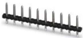
The figure shows a 10-position version

Pin strip, nominal current: 12 A, number of positions: 7, pitch: 5 mm, color: black, contact surface: Tin, mounting: THR soldering, The maximum current depends on the plug used. The lower of the two current values apply for plug and pin strip. The pin strip is made of highly temperature resistant plastic and is thus suitable for the reflow process.