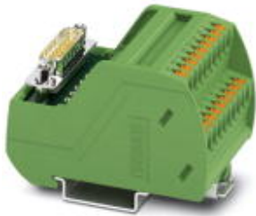
The illustration shows a 15-position version

Please be informed that the data shown in this PDF Document is generated from our Online Catalog. Please find the complete data in the user's documentation. Our General Terms of Use for Downloads are valid ( http://download.phoenixcontact.com )