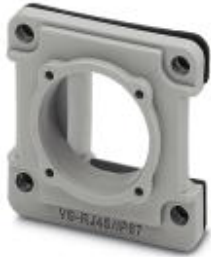
RJ45 panel mounting frame, IP67, for modular socket inserts (Keystone), for square panel cutout, with grommet, without mounting screws, color: gray

Please be informed that the data shown in this PDF Document is generated from our Online Catalog. Please find the complete data in the user's documentation. Our General Terms of Use for Downloads are valid ( http://download.phoenixcontact.com )