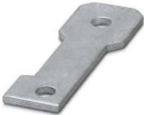
Plate for fixing the FLT-ISG-100-EX isolating spark gap to a flange, drill hole diameter of 11 mm.

Please be informed that the data shown in this PDF Document is generated from our Online Catalog. Please find the complete data in the user's documentation. Our General Terms of Use for Downloads are valid ( http://phoenixcontact.com/download )