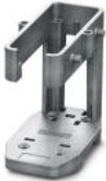
HEAVYCON plug assembly frame, lower part for double locking latch, for sleeve housing with double locking latch or HC-CIF..HFFD..., for type B16 contact inserts

Please be informed that the data shown in this PDF Document is generated from our Online Catalog. Please find the complete data in the user's documentation. Our General Terms of Use for Downloads are valid ( http://download.phoenixcontact.com )