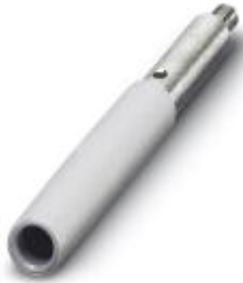
Female test connector, Color: gray

Please be informed that the data shown in this PDF Document is generated from our Online Catalog. Please find the complete data in the user's documentation. Our General Terms of Use for Downloads are valid ( http://download.phoenixcontact.com )