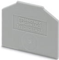
End cover, Length: 43.5 mm, Width: 1.5 mm, Color: gray

Please be informed that the data shown in this PDF Document is generated from our Online Catalog. Please find the complete data in the user's documentation. Our General Terms of Use for Downloads are valid ( http://download.phoenixcontact.com )