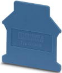
End cover, Length: 42.5 mm, Width: 1.5 mm, Height: 54 mm, Color: blue

Please be informed that the data shown in this PDF Document is generated from our Online Catalog. Please find the complete data in the user's documentation. Our General Terms of Use for Downloads are valid ( http://phoenixcontact.com/download )